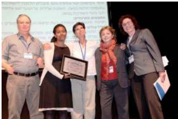
לפרטים ונימוקי הועדה הציבורית להענקת האות... לחצו כאן