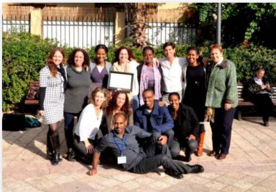
צוות העמותה בכנס